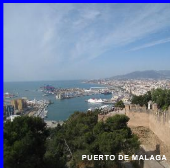
PUERTO DE MALAGA