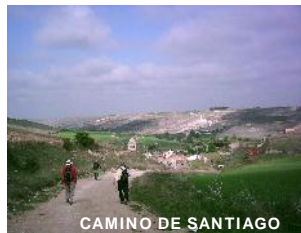
CAMINO DE SANTIAGO