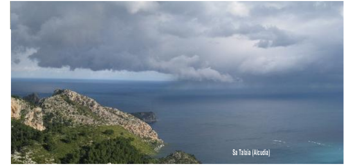
Sa Talala (Alcudia)

SENTIRÉ LA ALEGRÍA DE ABRIR LA NUEVA PUERTA, NO LA CIERRES BUEN AMIGO, DISFRÚTALA JUNTO A MÍ.