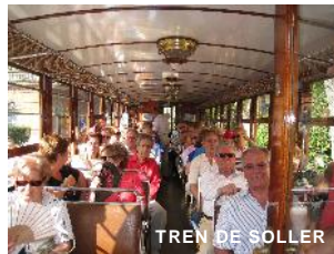
TREN DE SOLLER