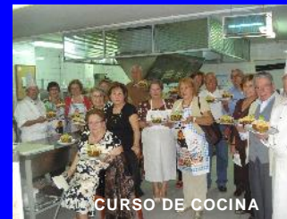
CURSO DE COCINA