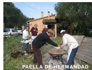
PAELLA DE HERMANDAD