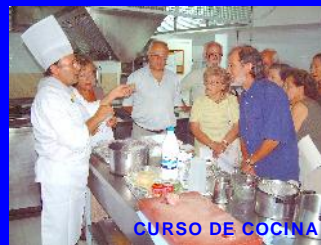
CURSO DE COCINA

ACTIVIDADES DE OCIO, SALUD Y CULTURA: EXCURSIONES POR TODA LA ISLA CURSOS DE COCINA, INFORMÁTICA, DIBUJO Y SOCORRISMO SENDERISMO - CON GUÍAS EXPERIMENTADOS VIAJES DE GRUPO- A PRECIOS MÓDICOS COMIDAS, CENAS Y PA AMB OLI VISITAS CULTURALES, TEATRO, OPERA, BALLE INTERCAMBIOS FOTOGRÁFICOS