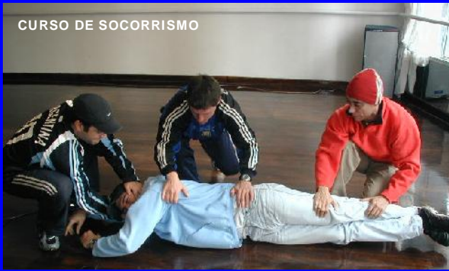
CURSO DE SOCORRISMO