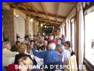
SA GRANJA D'ESPORLES